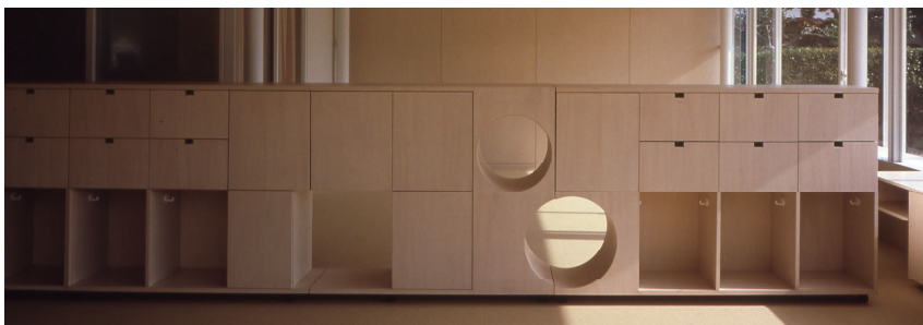
トンネル家具 tunnel furniture