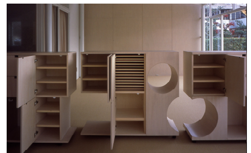
家具は分割できる furniture can be divided

This architecture is an extension of a nursery school affiliated with Ohta Nishinouchi Hospital. Because light at the child care room side had to be blocked during the construction period, roof panels and bolted connection were used to minimize the construction period. The extension has a combination of opaque and translucent ceilings, which make the space look like an "engawa" added to the existing architecture. The addition of this extension blurs the border between the inside and the outside. An intermediate space between the inside and the outside was created, where people feel as if the child care room has been extended outside, and also feel as if the playground comes into the child care room. As a result, the children can conduct activities continuously in the internal space and at the playground.