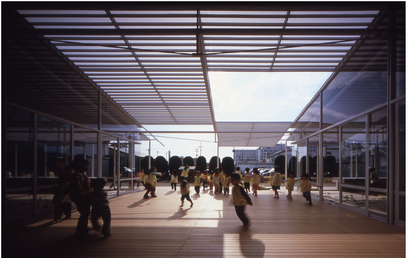
新設木製テラスをみる view toward wooden terrace

建築概要：主要用途 main use：保育園 nursery school 敷地面積 site area：990.12㎡ 建築面積 building area：112.00㎡ (TOTAL 528.57㎡) 延床面積 total floor area：112.00㎡ (TOTAL 673.86㎡) 掲載誌：新建築2006年1月号, GA JAPAN 78号