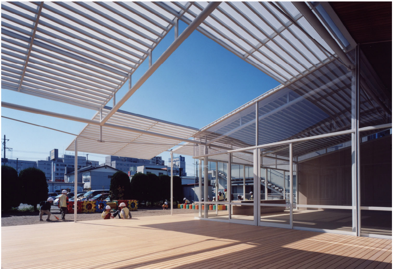
木製テラスをみる view toward wooden terrace