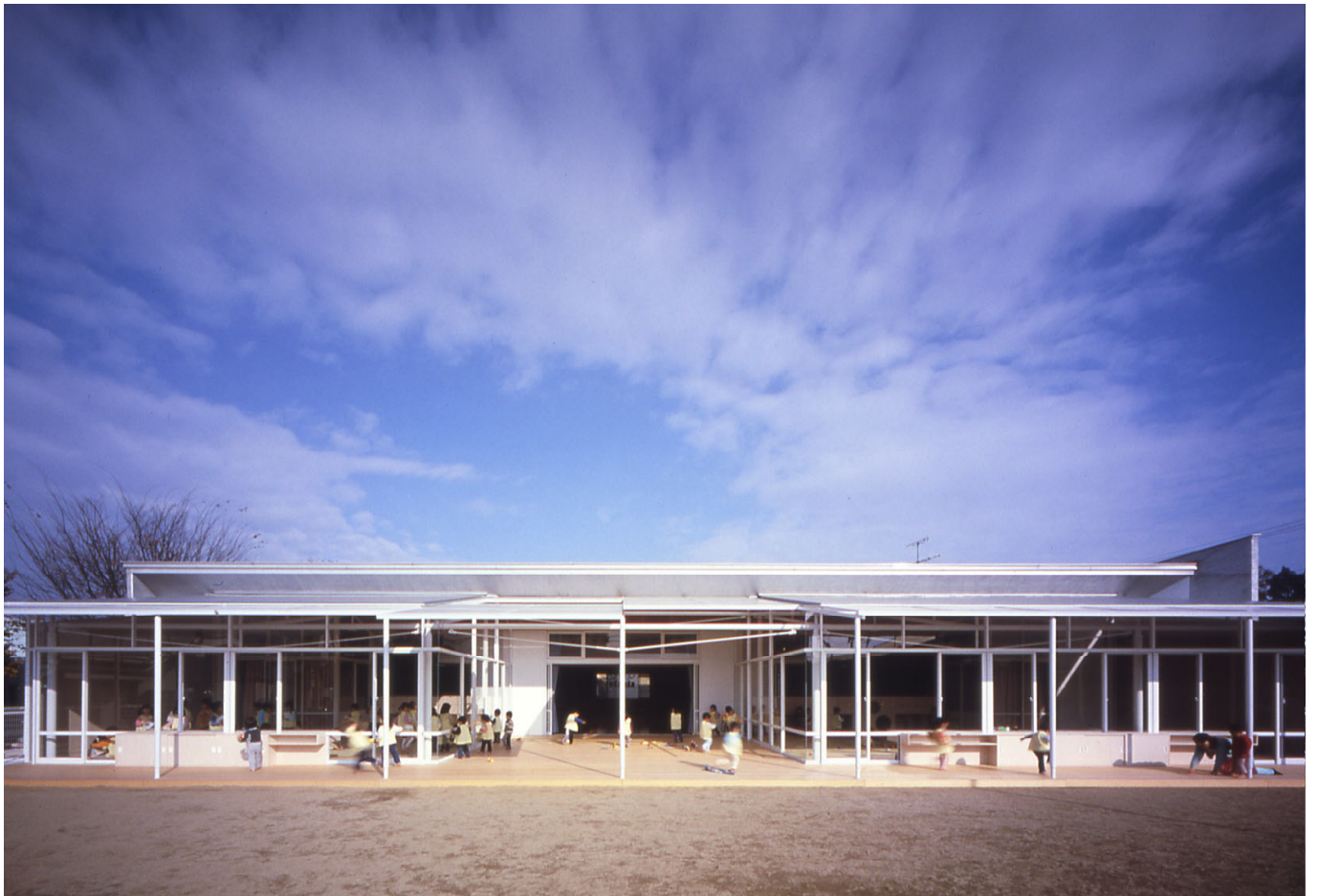
南側外観 view from south